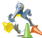
Illustrationen Pinguin Paul Yann Lange